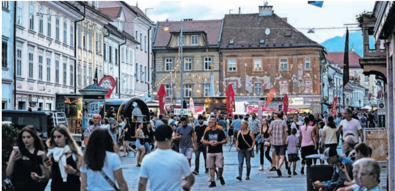
Program Prešernega poletja na ulicah Kranja ustvarja prijeten vrvež.

Od junija dalje postaja program vedno bolj raznolik. Kulinarčnim dogodkom se priključujejo še športni, glasbeni, zabavni in kulturni. Športni dogodki medna-