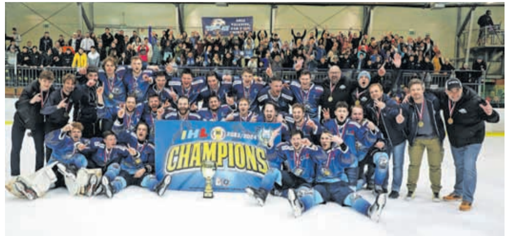
Hokejisti Triglava so se veselili naslova prvakov Mednarodne hokejske lige skupaj z navijači.

»Za nas je bila sezona malo drugačna kot prejšnje, saj smo po dolgem času imeli drugega trenerja. Tako je bil tudi sistem treningov in tekem malce drugačen. Toda skozi sezono smo bili vse boljši. Skupaj smo rasli in na