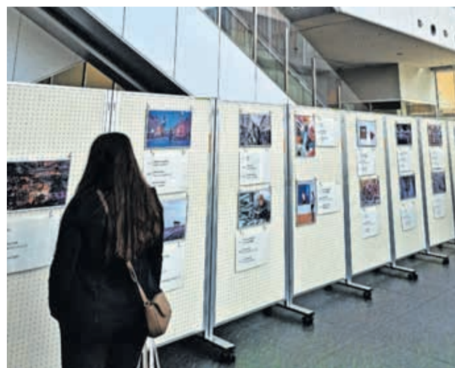
Gostitelji so fotografsko razstavo postavili na najbolj frekventno lokacijo v središču mesta ob železniški postaji.