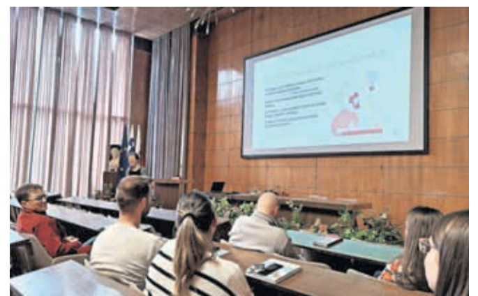
Aprila smo izpeljali že tri delavnice.

Kranj – V proračunih Mestne občine Kranj za leti 2025 in 2026 bo 1.250.000 evrov namenjenih izvajanju participativnega proračuna. To pomeni dobrih 48 tisoč evrov na posamezno krajevno skupnost. O tem, kateremu projektu bo denar namenjen, bodo odločali občani, ki lahko predloge oddajo do konca maja. Jeseni bo na vrsti glasovanje. Ideja in dober predlog pa nista dovolj. Kako torej pripraviti kakovosten in premišljen predlog? V pomoč pri načrtovanju bo vsekakor znanje, pridobljeno na delavnicah, ki jih MOK izvaja v sodelovanju z lokalno skupnostjo in strokovnjaki. »Na srečanjih skupaj pretrčimo vse predloge, povemo, kako predlog pravilno oddati, in seveda odgovarjamo na vprašanja. Za nami so že tri uspešno izpeljane delavnice. Posnetek uvodne delavnice