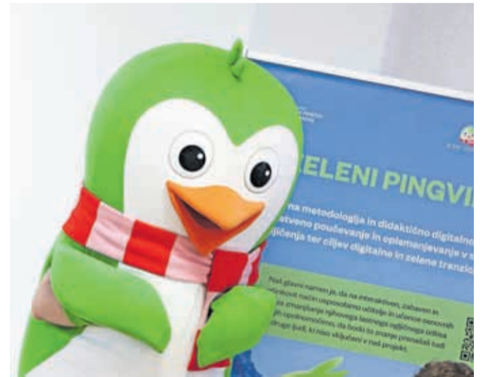
V projektu Zeleni pingvin so pilotno sodelovale tudi tri kranjske osnovne šole.

Digitalna platforma, ki je osrednje orodje projekta Zeleni pingvin – Green Penguin, je bila razvita s ciljem zagotavljanja podpore za doseganje ogljične nevtralnosti z izobraževanjem in vključevanjem državljanov. Glavni namen aplikacije je ozaveščanje otrok in njihovih staršev o varovanju okolja, razumevanju ogljičnega odtisa in podnebnih sprememb. Zeleni pingvin v spletni in mobilni platformi spodbuja otroke k vzpostavljanju vsakodnevnih navad, ki pripomorejo k nižanju ogljičnega odtisa tako na individualni kot na ravni šole. Podžupanja Manja Zorko je v nagovoru poudarila, da namerava Kranj do leta 2030 postati podnebno nevtralno in pametno mesto ter postati vzor za ostala evropska mesta: »Projekt Zeleni pingvin naša prizadevanja še dodatno podpira in nagovarja ciljno publiko – mlade.« Eva Romih iz Urada za