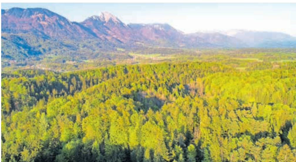
Udin boršt

8 kilometrov, poleg rekreacije v čudoviti naravi pa organizatorji obljublajo tudi okusno okrepčilo in spoznavanje kulturnih ter naravnih spomenikov. Vstopili smo v letni čas, ko vedno več časa preživimo v naravi. Če jo želimo še naprej ohranjati tako, kot je, za prihajajoče generacije, je nujno, da je vsak naš obisk odgovoren. Skrbite, da narava za vami ostane čista!