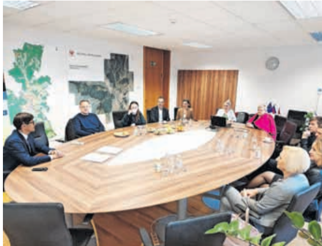
Aprila so zavezo o podpori podnebnemu načrtu podpisali še novi partnerji Mestne občine Kranj.

Kranj – Zavezo o podpori prizadevanjem Kranja za doseg podnebne nevtralnosti do leta 2030 marca je ta mesec podpisalo še enajst podjetij in drugih organizacij iz Kranja in širše. Kot smo že poročali, je Mestna občina Kranj kot del Misije 100 podnebno nevtralnih in pametnih mest do leta 2030 sredi marca Evropski komisiji že oddala podnebno pogodbo z ukrepi za doseg ciljev, finančno konstrukcijo in zaveze 38 partnerjev o podpori prizadevanjem za podnebno nevtralnost. Skupaj z naknadnimi podpisniki so tako v Bruselj poslali 49 zavez podpore kranjskemu podnebnemu načrtu. To še ni končna številka, saj je namero o podpisu zaveze izrazilo še nekaj drugih, tudi ministrstev. »Če želimo uresničiti cilje, ki smo si jih zadali v naši podnebni pogodbi, je pomembna podpora na vseh ravneh – tako v lokalni skup-