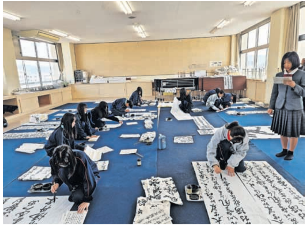
Župan je z delegacijo obiskal tudi šole, s katerimi si dopisujejo kranjski učenci. Japonsčina ima več tisoč pismenk, v osnovni šoli se jih naučijo tisoč.

»Navdušen sem nad sprejemom v Fukuiju – o Kranju se je govorilo na vsakem koraku – in tem, koliko šolarji, profesorji in gospodarstveniki vedo o Kranju. Podrobneje smo spoznali njihova področja delovanja, eni druge seznanili s primeri dobrih praks in odprli številna vprašanja, na katerih bomo gradili sodelovanje v prihodnje. Delegacijo iz Fukuija prič-