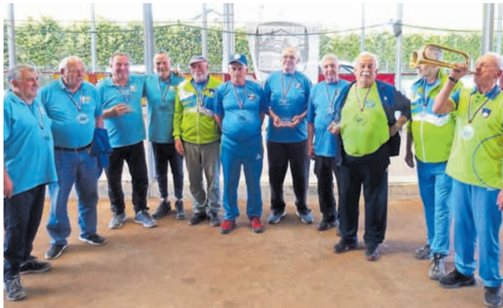
Na turnirju so bili uspešni tudi domači balinarji.