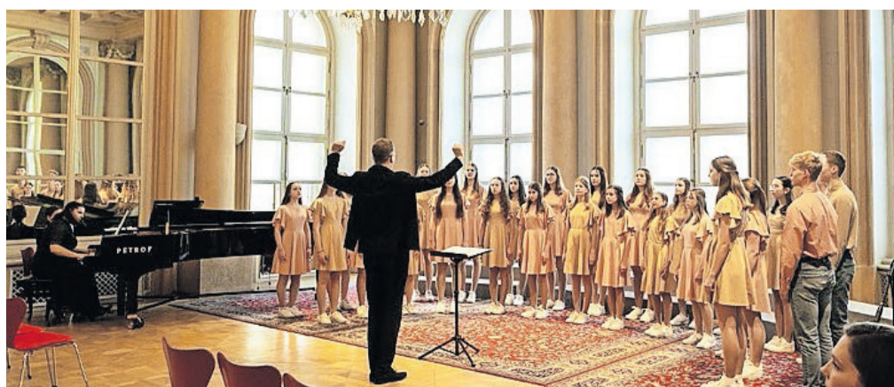
Mladinski pevski zbor OŠ Predoslje se je izkazal na zborovskem tekmovanju v Bratislavi.