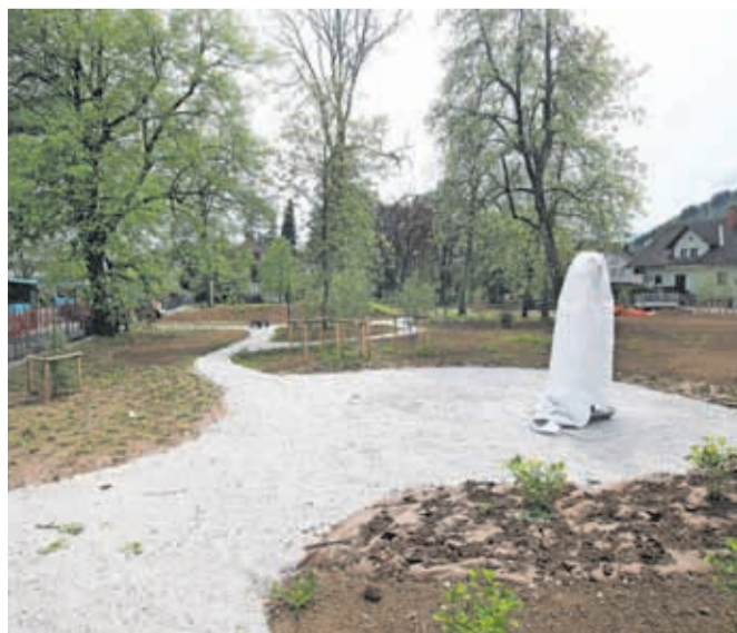
Bleiweisov park so začeli urejati lansko jesen.