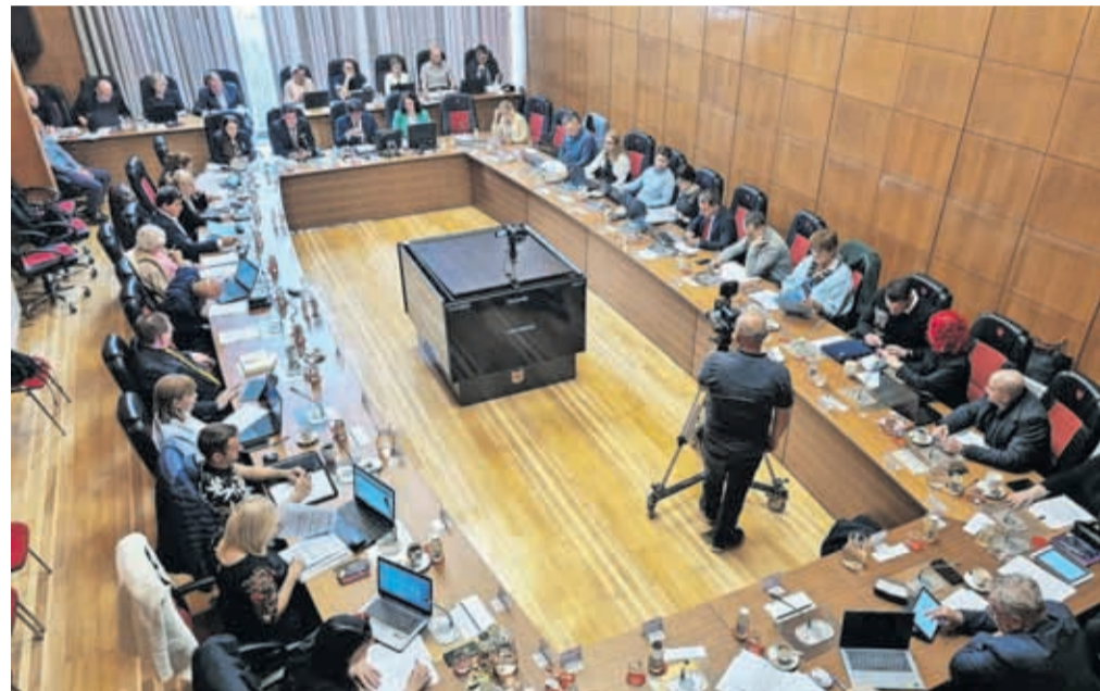
Seje mestnega sveta so v skladu z lanskim sklepom začeli snemati (zvok in slika). Posnetek bo po vsaki seji najkasneje v desetih delovnih dneh objavljen na spletni strani občine.