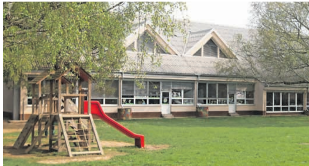
Podružnična šola in vrtca na Kokrici

MOK bo po pridobitvi pravnomočnega gradbenega dovoljenja pristopila k izgradnji prve faze projekta, ki vključuje rekonstrukcijo ob-