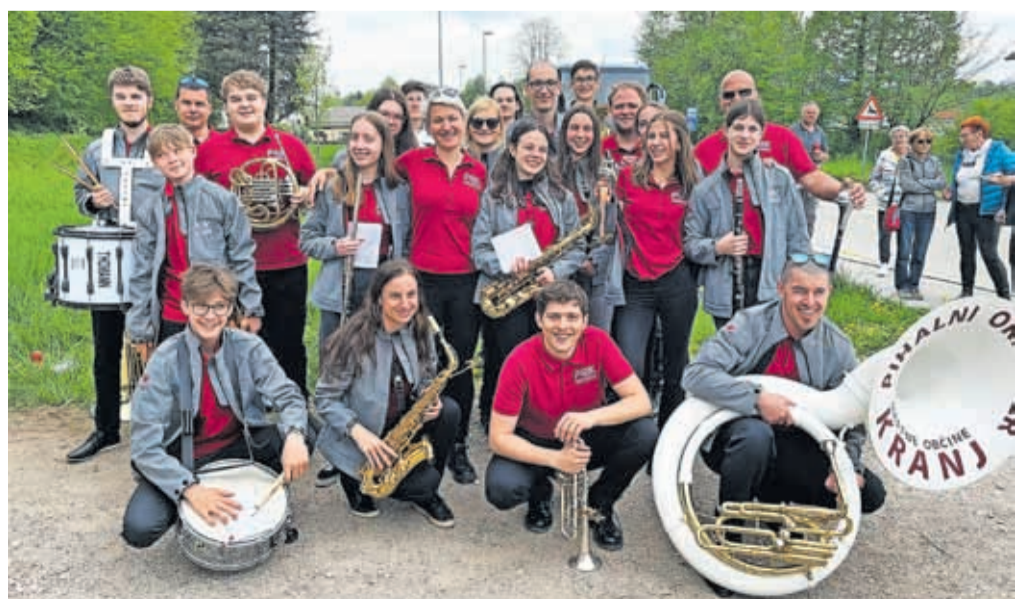
Pihalni orkester Mestne občine Kranj

Vabljeni, da se jim pridružite in skupaj z njimi proslavite praznik dela. Okvirna časovnica je objavljena v kalendarju prireditev na 9. strani Kranjskih novic.