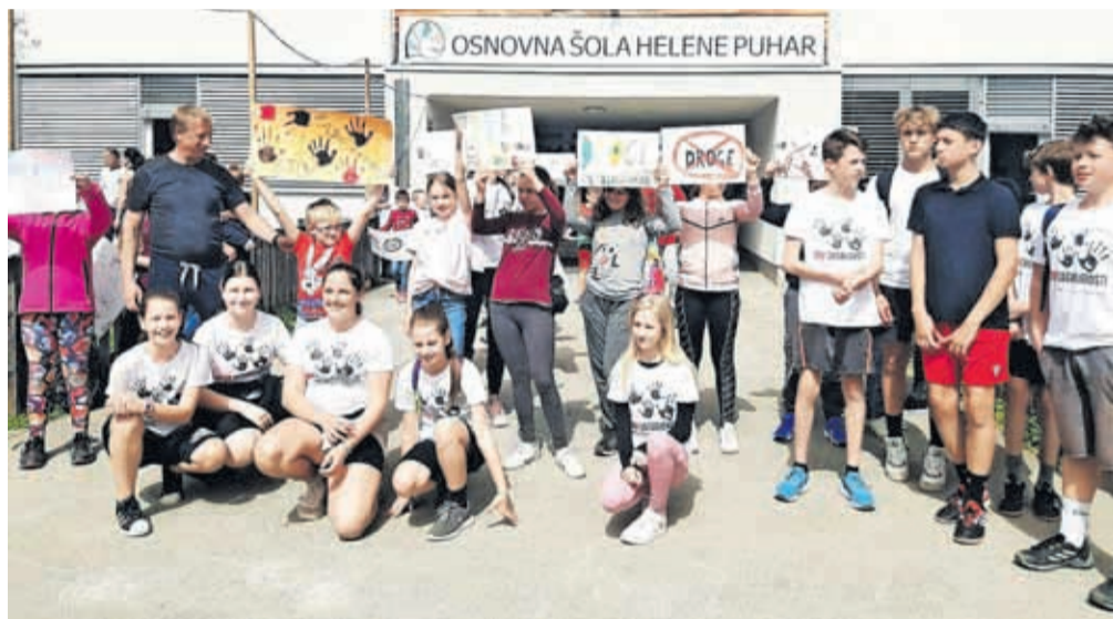
Učenci so po javnih zavodih zbirali misli o spopadanju z zasvojenostjo.

panji Manji Zorko. »Najlepša hvala tekačem za to zbirko misli, ki bodo zagotovo dobro izhodišče za razmislek, kje smo in kam gremo, ter predvsem spodbuda k zdravemu načinu življenja,« je ob tem dejala podžupanja. Na MOK je potekalo tudi strokovno izobraževanje za strokovne delavce in učitelje ter za starše na temo Kaj nas obvaruje pred zasvojenostjo.