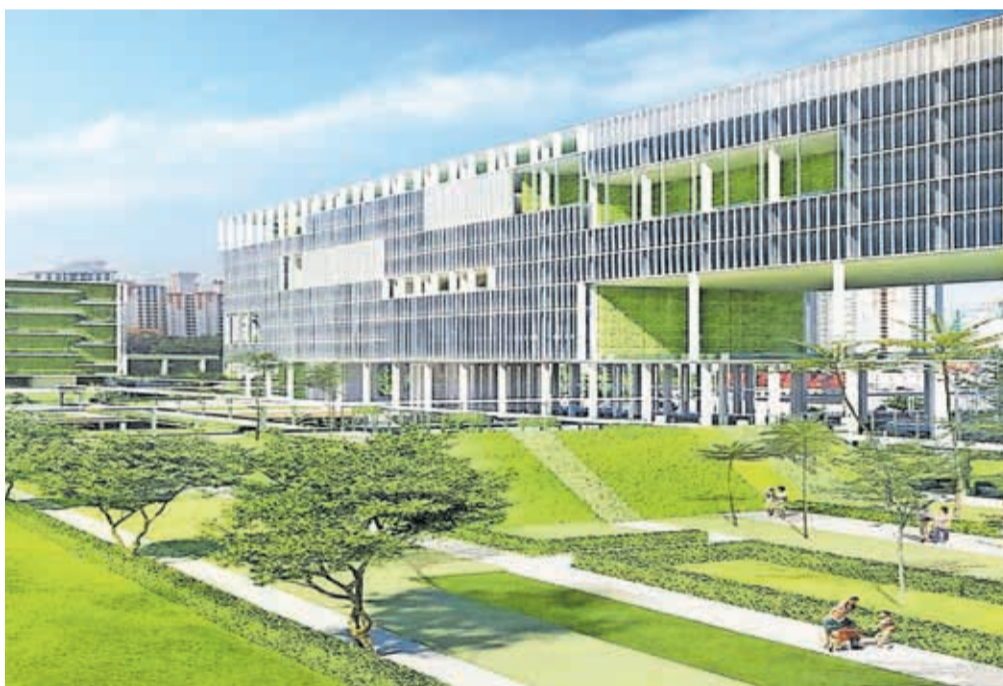
Lokacijo regijske bolnišnice v Kranju javno podpira že šestnajst občin.