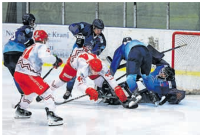
Finalne tekme je ekipa Triglava odigrala s Crveno zvezdo.